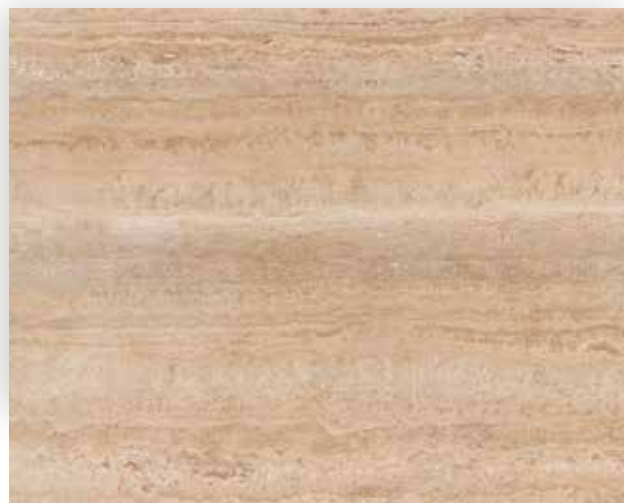
Classic • Controfalda